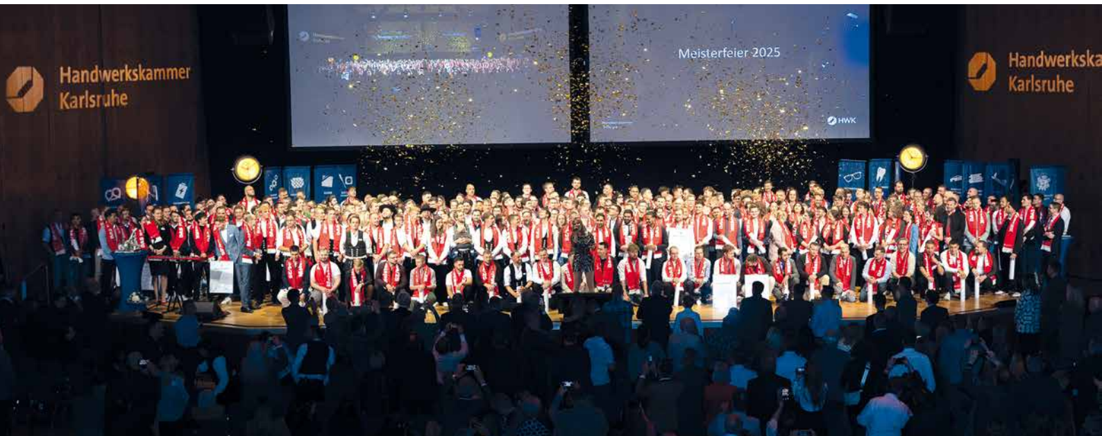
Meisterhaft: Auf 380 neue Meisterinnen und Meister ist die Handwerkskammer Karlsruhe stolz. Im Durchschnitt sind die Absolventen 28,5 Jahre alt

Handwerkskammer Karlsruhe würdigt meisterhafte Leistungen