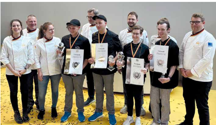
Die Preisträgerinnen und Preisträger bei der Preisverleihung

Die Meisterschaft verdeutlicht, dass das traditionelle Handwerk trotz zunehmender Automatisierung und Digitalisierung nichts an Relevanz verloren hat – im Gegenteil: Es zeigt sich innovativ, zukunftsorientiert und fachlich auf höchstem Niveau.