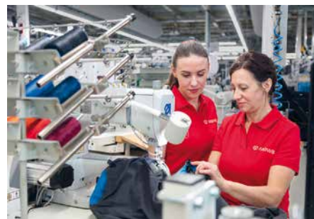
Die Reparatur der Berufskleidung ist fester Bestandteil des Rundum-Service

instandgesetzt werden. Das Verwerten von ausgemusterten Kleidungsstücken ist ebenfalls gängige Praxis, damit noch funktionstüchtige Teile wieder zum Einsatz kommen.