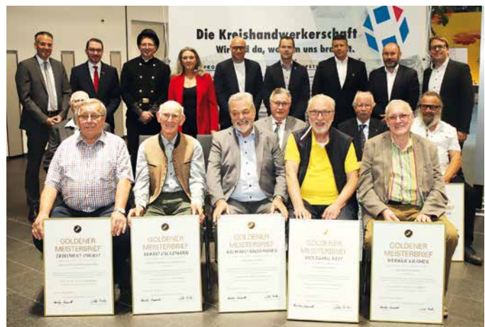
Ehrung Goldener Meisterbrief für 50 Jahre Meisterprüfung