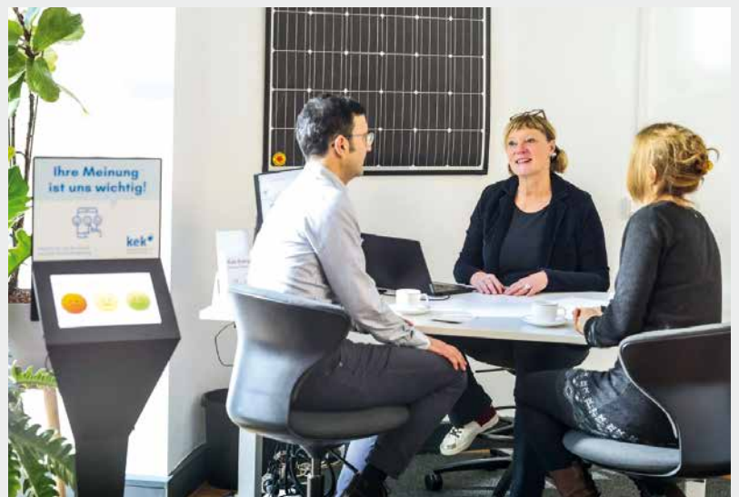
Beratung bei der Karlsruher Energie- und Klimaschutzagentur – kostenfrei, unabhängig und neutral