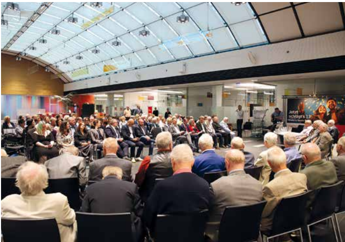
Zahlreiche Festgäste würdigten die Geehrten bei der Feierstunde

In den Hallen präsentierten sich Unternehmen, Vereine und Institutionen mit einem bunten Mix aus Freizeit, Lifestyle, Bauen, Wohnen und regionalen Spezialitäten. Besonders beliebt waren die vielen Mitmachangebote, Vorführungen und Themenwelten, die den Gästen erlaubten, Neues auszuprobieren und direkt mit Ausstellern ins Gespräch zu kommen.